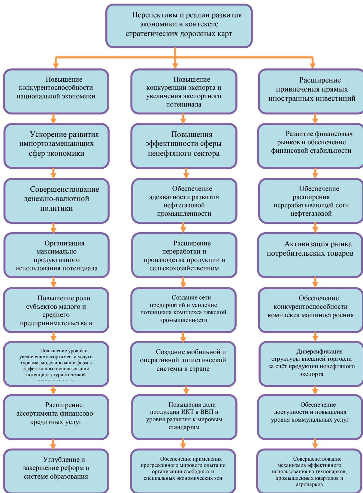
Рисунок 2. Перспективы и реалии развития экономики в контексте стратегических дорожных карт в Азербайджанской Республике (составлено автором).